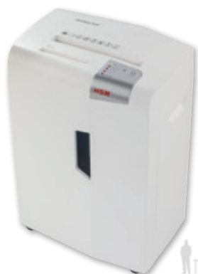
HSM shredstar X13