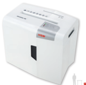
HSM shredstar X8