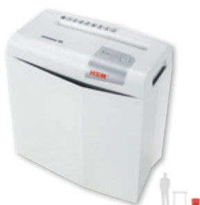
HSM shredstar S5

Proste niszczenie płyt CD (z wyjątkiem modelu HSM shredstar S5).