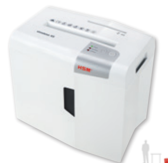
HSM shredstar X5