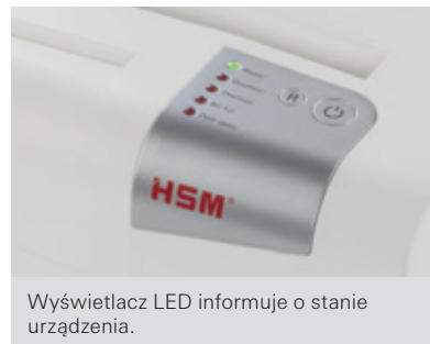
Wyświetlacz LED informuje o stanie urządzenia.