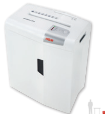
HSM shredstar X10