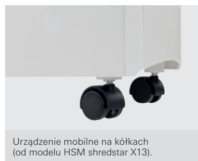
Urządzenie mobilne na kółkach (od modelu HSM shredstar X13).