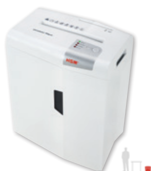
HSM shredstar X6pro